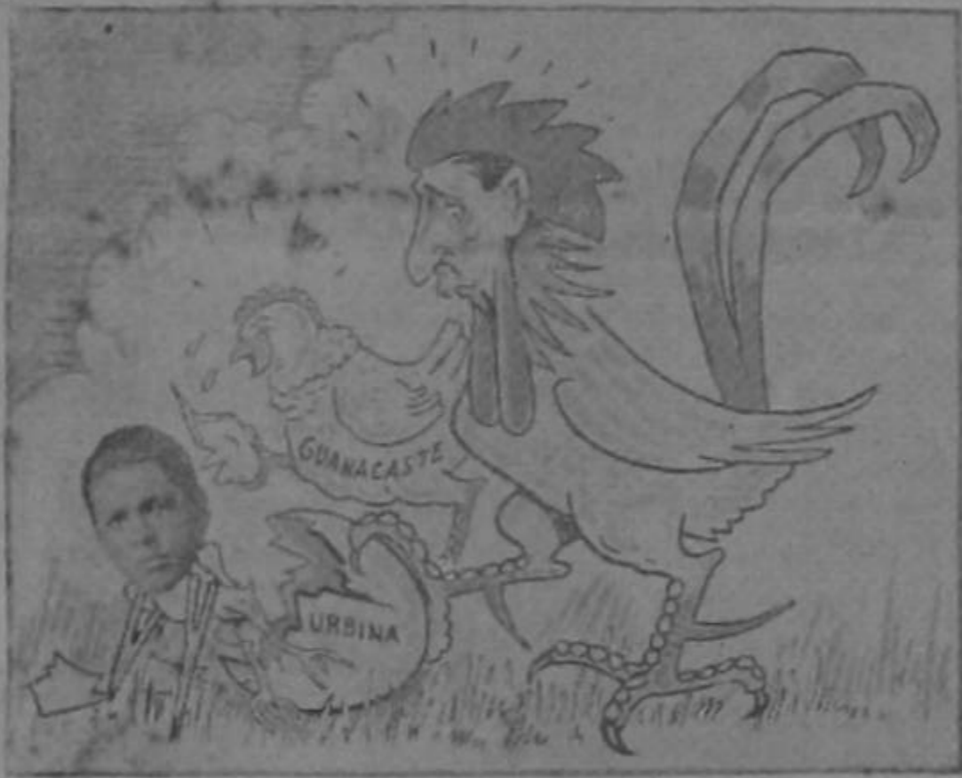
EL GALLO:—Por lo que veo, el huevo nos resultó con pollo...

tos, nos llegó el que es tenor. De modo, pues, que hay tamaña equivocación. El que está en Costa Rica es un tenor famoso que gorjea como un canario. Y lo grave es que no tiene la culpa del lío en que lo han metido. Cuando llegó a la estación lo secuestraron en un automóvil sin darle tiempo a explicar las cosas. De allí que el esperado